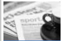
nachles-bar Schrages und Buntes aus der Medien- und Sportwelt

reich, unter anderem Pfizer Schweiz, Allianz, T-Mobile, Ikea und nennt Lobbying, Marketing und Sales als Hauptgeschäftsbereiche. Es sei ein Irrtum zu glauben, «dass jene, die grosse Netzwerke haben, einflussreicher sind als andere», erklärt «FAS.research»-Leiter Harald Katzmaier. In vielen Projekten stelle er im Gegenteil fest: «Es sind die mittelgrossen Netzwerke – nicht zu gross und nicht zu klein – in denen der grösste Druck aufgebaut wird, dass Leute das selbe kaufen, wählen, denken.» Katzmaier empfiehlt: «Lernen Sie Ihr Netzwerk kennen, identifizieren Sie relevante Schlüsselpersonen, betrachten Sie Beziehungen rund um die Netzwerkknoten und schon gelingt es, daraus geeignete Handlungsstrategien abzuleiten» – zum Beispiel auch für Trainer von Fussballteams. www.fas.at